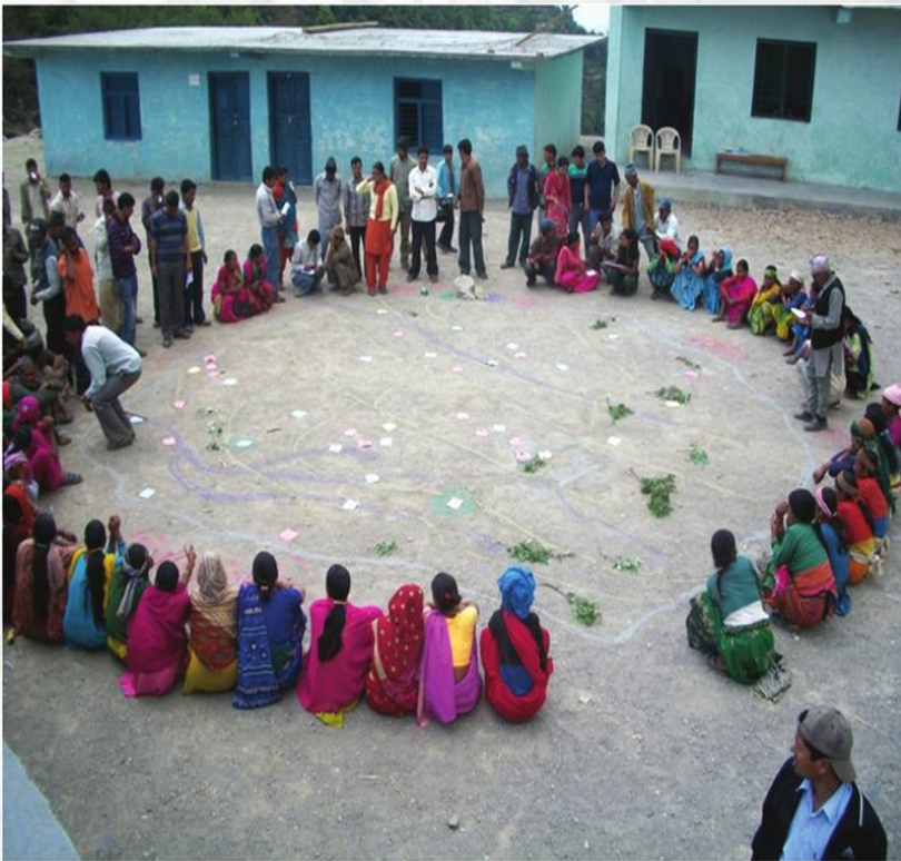
संकटासन्नता विप्लेषण तथा सामाजिक नक्सांकन

दुर्गम ग्रामिण भेगमा वसोवास गर्ने समुदाय खास गरी, गरीब, विपन्न, महिला, बालबालिका, पछाडी पारिएका वर्ग, कृषकहरुको सामाजिक रुपान्तरण र दिगो जिविकोपार्जनका माध्यम वाट आर्थिक सम्वृद्धि गरि उनिहरुको जिवनस्तरमा सुधार ल्याउनका लागि सरकारी, राष्ट्रिय/ अन्तराष्ट्रिय गैर सरकारी संस्था र विभिन्नदातृ निकायसंग मिलेर दिगो एकिकृत विकासमा सहयोग पुऱ्याउनु हो।