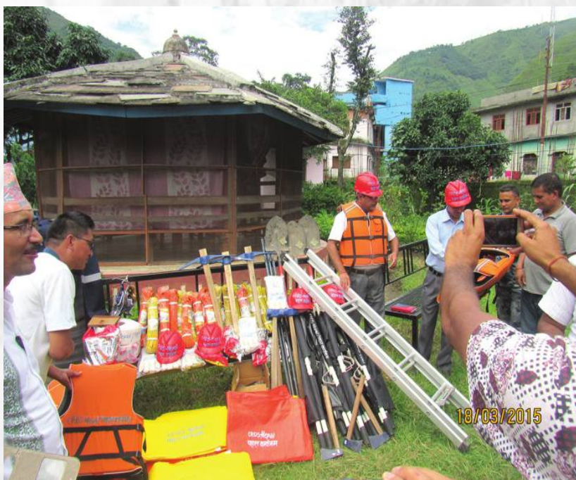
विपद व्यवस्थापन सँग सम्बन्धित समान हस्तान्तरण