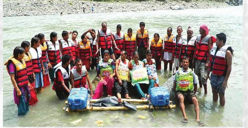
खोजतलास तथा उद्धार तालिम

स्थापनाकाल देखी नै सिआरडीयस-नेपाल ले दुर्गम ग्रामिण भेगका गरिब पछाडीपारिएका सिमान्तकृत र विभेदमा पारिएका समुदाय लाई उनिहरुको अधिकार रक्षा, गुणस्तरिय जिवनयापनको लागि जिविकोपार्जनमा सुधार र समुदायहरुको वलियोसंस्था निर्माणको लागि विभिन्न विकास निर्माण र जनचेतनामूलक कार्यक्रमहरु संचालन गर्दै आईरहेको छ । अधिकार मुखि कार्यपद्धति लाई अवलम्बन गरि ग्रामिण समुदायको शसक्तिकरण, आर्थिक समृद्धि, सामाजिक रुपान्तरण र समावेशी विकास प्रक्रियामा यस्ले उल्लेखनिय योगदान पुर्याएको छ । आर्थिक समृद्धि, सामाजिक रुपान्तरण र समावेशी विकासका माध्यम वाट गरिब, विपन्न, पछाडी पारिएका दुर्गम ग्रामिण भेगमा वसोवास गर्ने समुदायको सामाजिक आर्थिक रुपान्तरणका माध्यम वाट समतामूलक समृद्ध समाज निर्माणका लागि उपयुक्त वातावरण सृजना गर्ने कार्यमा सधै क्रियाशिल रहेको छ । स्थानिय स्तरमा एकिकृत सामुदायिक विकास कार्यक्रमहरु संचालन गर्नुका साथै समुदायको वलियो