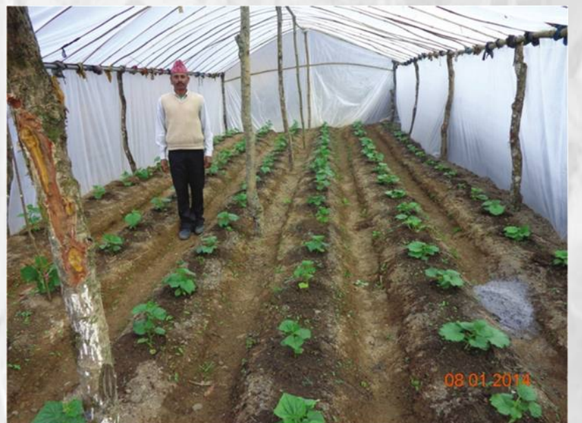
प्लाष्टिक घरमा वेमौसमी काको खेती