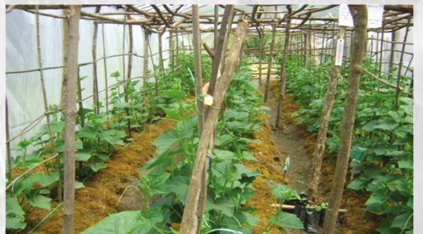
जैविक छापो प्रविधि